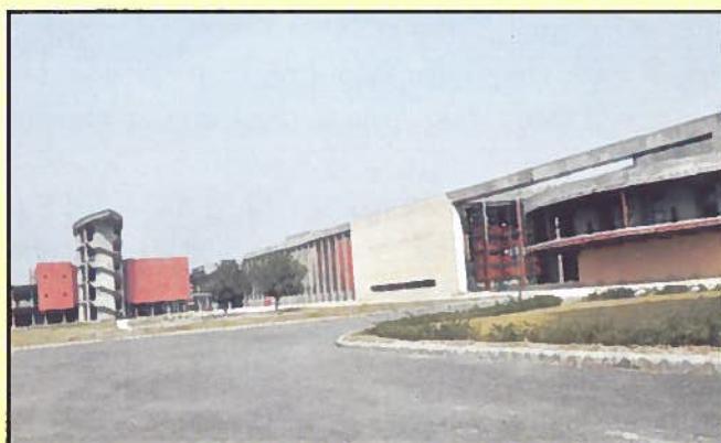
Administrative, Seminar and Academic Blocks

The Ministry of Food Processing Industries