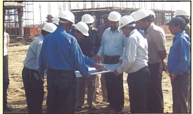
निर्माण स्थल पर सचिव, खा.प्र.उ.मं.

खाद्य प्रसंस्करण उद्योग मंत्रालय ने "निफटेम" परिसर के