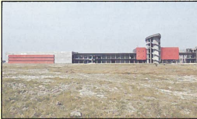
लाइब्रेरी, कफेटेरिया एवं पाइलेट प्लांट्स

ऐसा अनुमान है कि निफटेम 2015 तक 1000 छात्र एवं उद्यमी तैयार करेगा, 250 उद्यमों का संपोषण करेगा, 300 अनुसंधान परियोजनाएँ, 550 लघु अवधि के पाठ्यक्रम और खाद्य मानक व परीक्षण से संबंधित 450 परियोजनाएँ प्रारंभ करेगा और